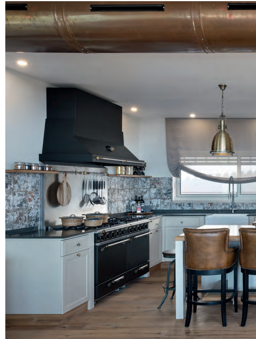
↕ המטבח. חיפוי הקיר הייחודי, שיובא במיוחד מספרד, מחבר בין הגווניס החלודים נחושתיים במרחב לבין גוני האפור והכחול השולטים בקיר חלל המדרגות. קונטרסט הגווניס והחומרים נשמר גם בין רצפת העץ החומה לחזיתות המטבח, בעוד משטח המטבח בגוון אפור כהה