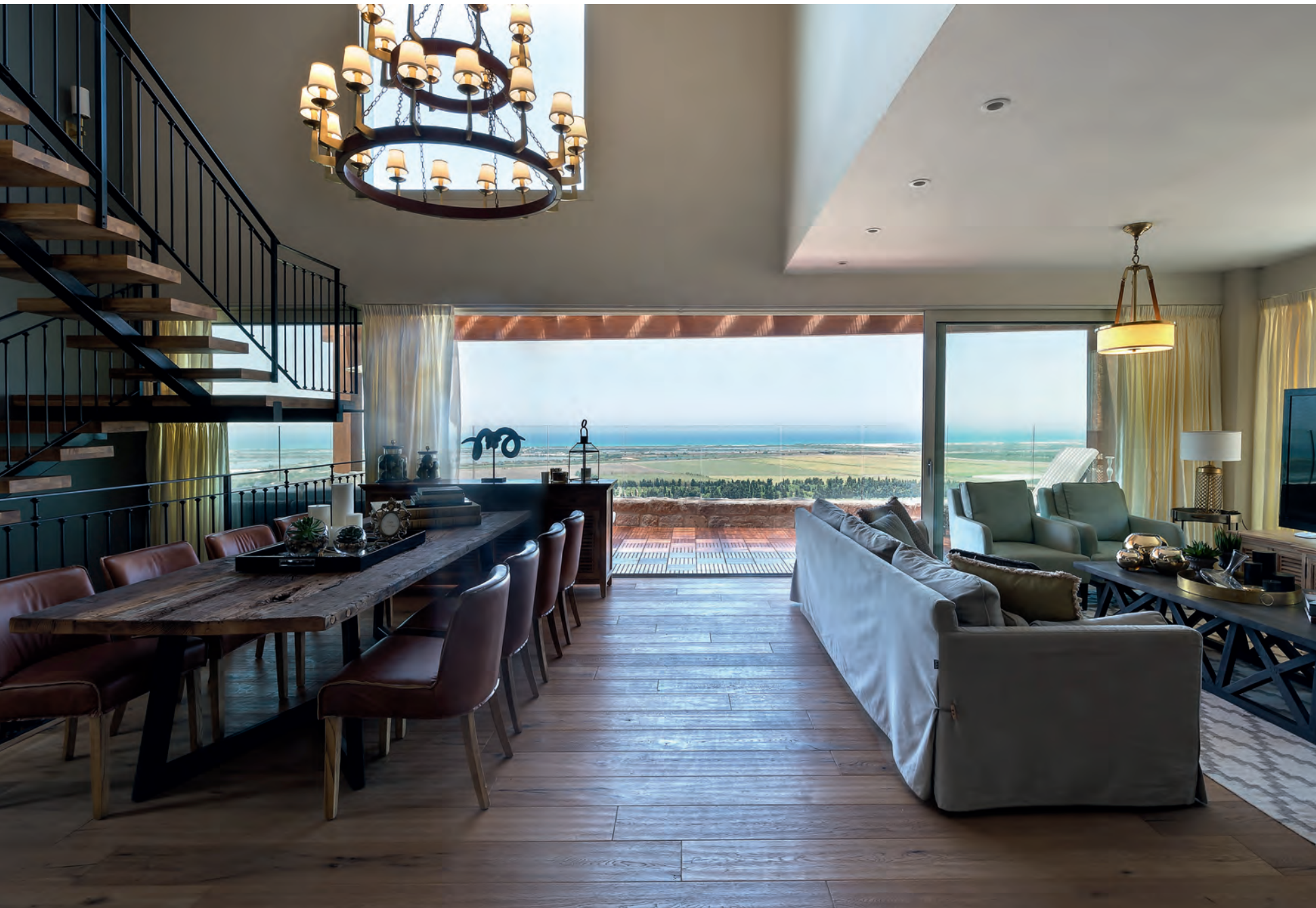
↑ בפינת האוכל הוצב שולחן בעל רגל ברזל מאסיבית עם נוכחות, ומעליה פלסת עץ גושני לא מעובדת. כיסאות העור שולבו בהלימה לצבעוניות החמימה