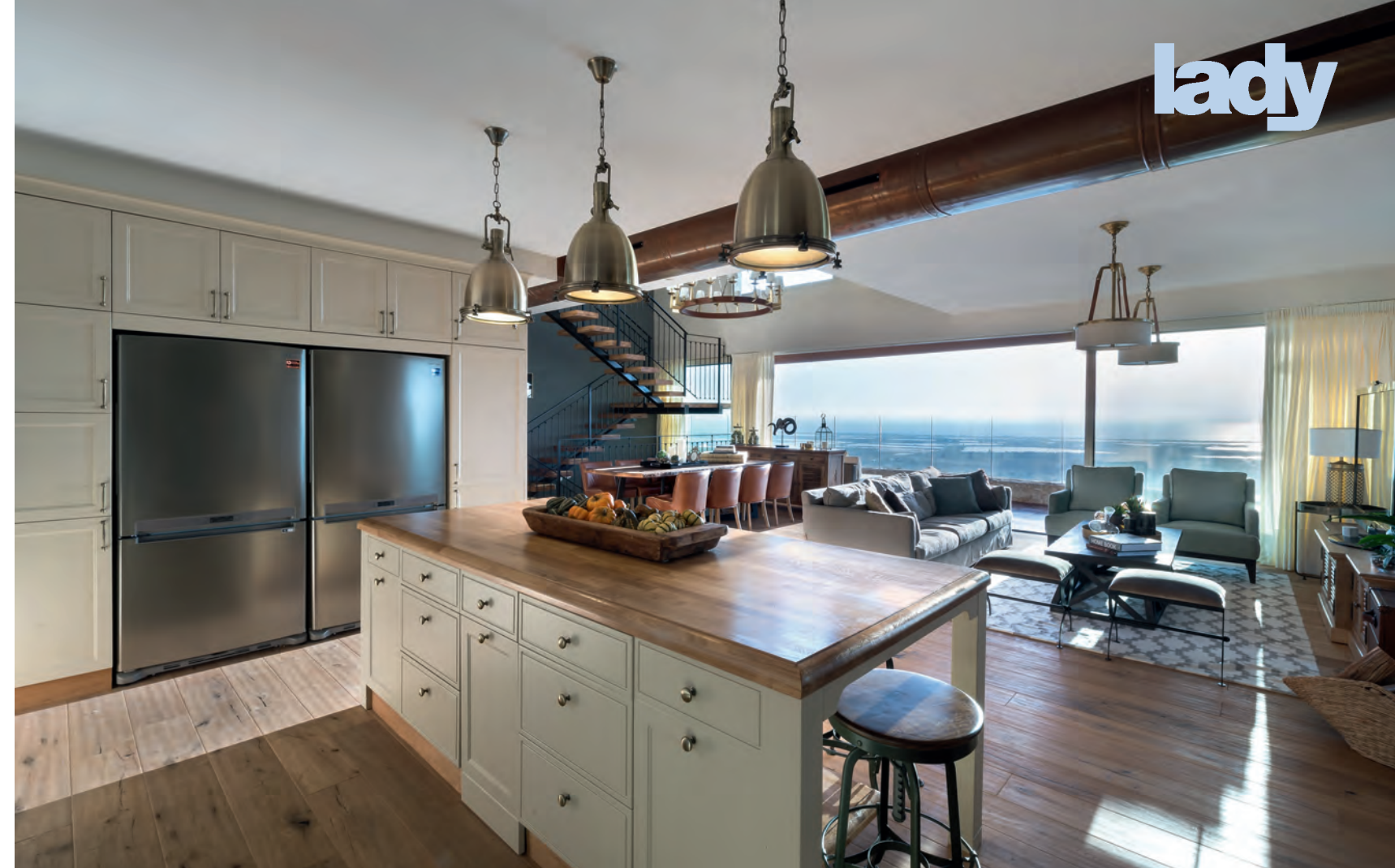
↑ הנוף הנגלה מבעד לחלון הוויטרינה מהווה חלק אינטגרלי מהחלל, וכך גם עוצמת האור הטבעי החודרת לתוכו ומשתנה לאורך היממה