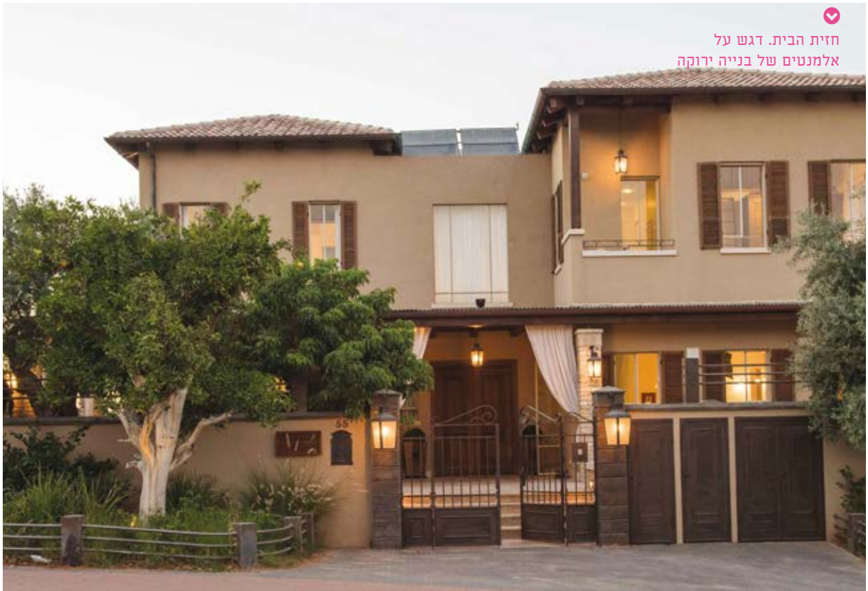
חזית הבית. דגש על אלמנטים של בנייה ירוקה